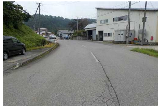
【A進行方向からの見とおし】