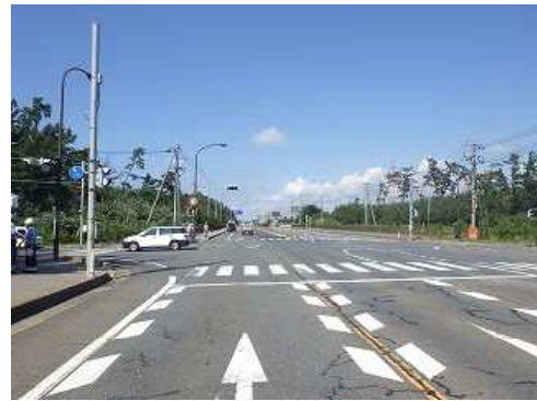
【A進行方向からの見とおし】