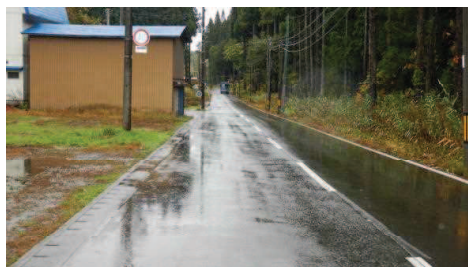
【A進行方向からの見とおし】