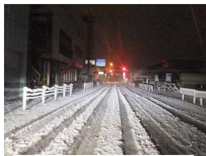
【A進行方向からの見とおし】