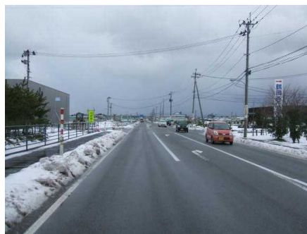
【A進行方向からの見とおし】