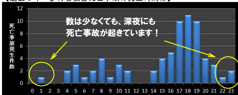
【過去5年 歩行者被害死亡事故の発生時間帯】